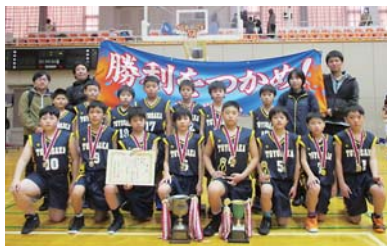
男子優勝・豊栄小学校