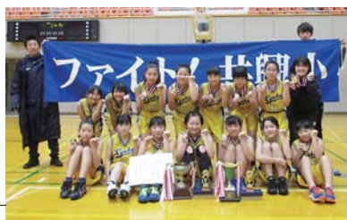
女子優勝・共興小学校